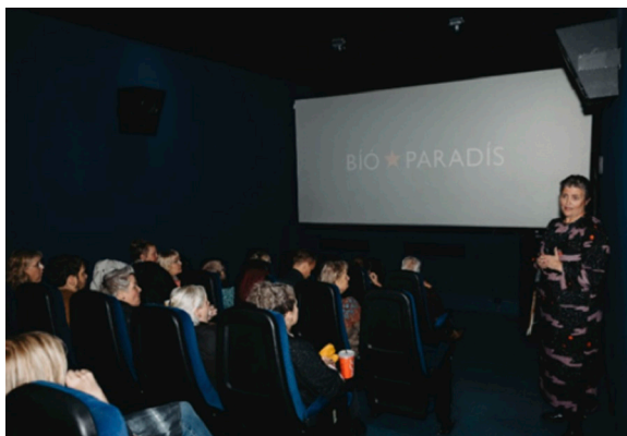
Myndir frá Bíó Paradís „Ola – venjulegur óvenjulegur gaur“

óvenjulegur gaur“ fimmtudaginn 19. október kl. 17.00 í Bíó Paradís. Sýningin var haldin í tilefni þess að Nordisk forum for socialpedagoga (NFFS) fundar í Reykjavík.