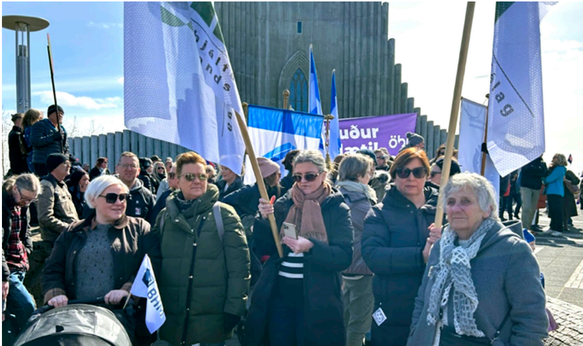
1. maí 2023 - þroskaþjálfar mættir í kröfugöngu