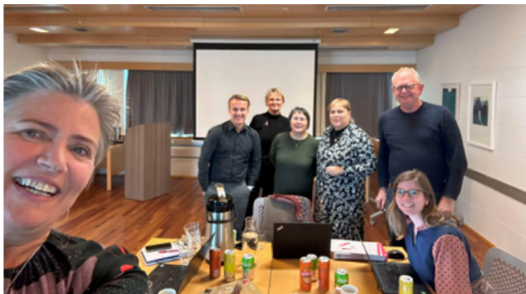
Myndir frá stjórnarfundum NFFS á Íslandi

Á fundinum sem haldinn var í október var nám proskapjálfa á Norðurlöndunum borin saman eins og gert var árið 2015.